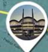
Sabiha Gökçen Havaalanı